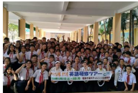
▲ベトナムの学生達と記念撮影

この研修でベトナムの友達がたくさんできました。彼らは日本語も習っていて、その熱意を目の当たりにし、私も夢の実現のためにもっと勉強しようと思いました。研修で学んだことを最大限に生かし、将来獣医師として海外でも活躍したいです。