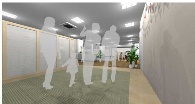
子どもが遊べる小上がりスペース