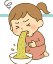
嘔吐／噁心想吐 はいた・はきそう