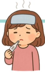
發燒 ねつ が ある