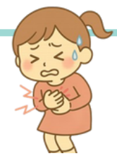
胸悶 むね が くるしい