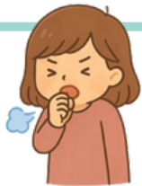
咳嗽 せき が する