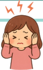
頭痛 あたま が いたい