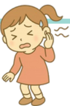
耳鳴 みみなり が する