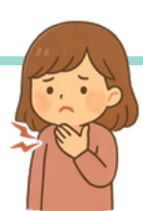
喉嚨痛 のど が いたい