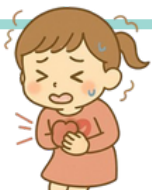
心悸 どうき が する