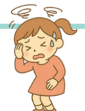
頭暈 めまい が する