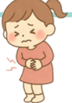
腹痛 おなか が いたい