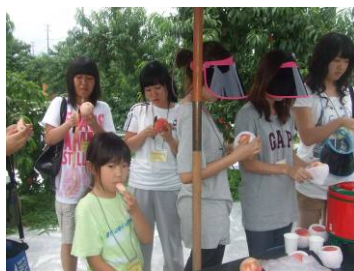
採れたての桃をその場でいただきました。「美味しい！甘い！」の連続！