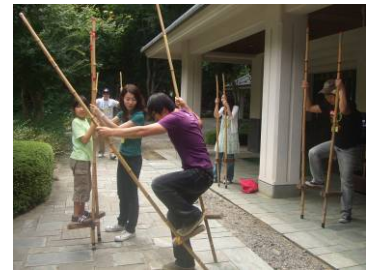
昔の遊び「竹馬」にも挑戦！民家園で出会ったもの全てに興味津々。