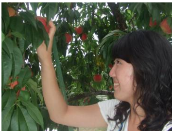
福島市が全国に誇る美味しい桃を自分の手で収穫することができました。