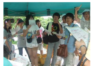
桃にまつわるクイズも行われました。これであなたも「もも博士」！？