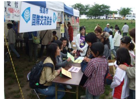
外国語ジャンケンからゲームスタート！

5月10日（土）に荒川桜つつみ河川公園で開催された荒川フェスティバルに『ふれあいテント』を出展しました。外国語ジャンケンやカーリングゲームといった国際的なアトラクションに多くの方々が挑戦してくれました。オリジナル缶バッジづくりも行われ、F-IFAと一般市民が楽しく触れ合えた、盛り沢山の交流の日となりました。