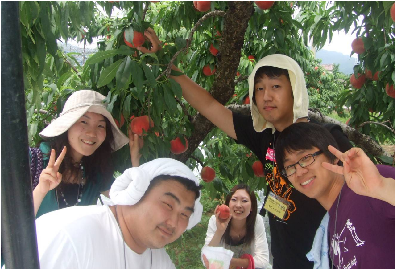
8月ふれあいイベント「もも狩りと民家園見学」のひとコマ