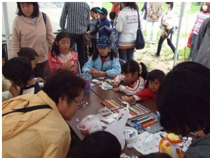
世界に一つだけのオリジナル缶バッジができました。