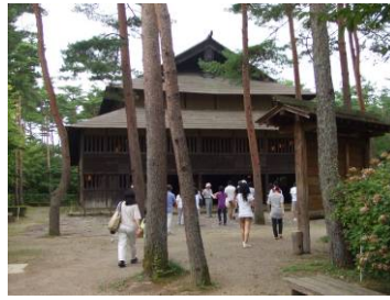
古民家の中は暑い8月にも関わらずひんやり涼しい。昔の人の知恵です。