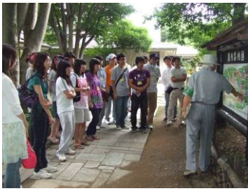
ボランティアガイドさんの説明を受けながら民家園を見学しました。

福島市民家園と飯坂・安齋果樹園を訪れるふれあいイベントが8月10日（日）に開催されました。（参加者27名）