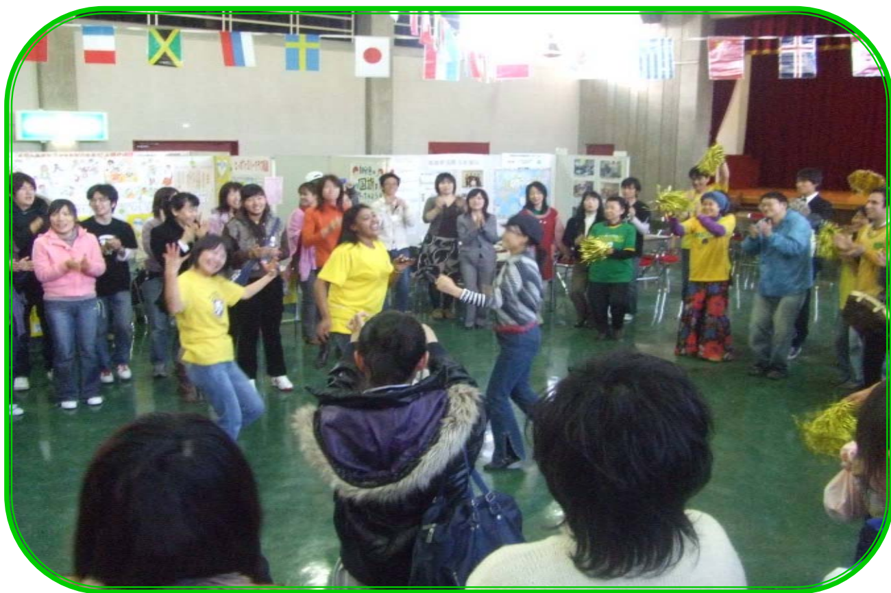
昨年度フィナーレの様子