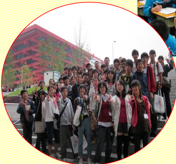
上海万博 中国館前にて