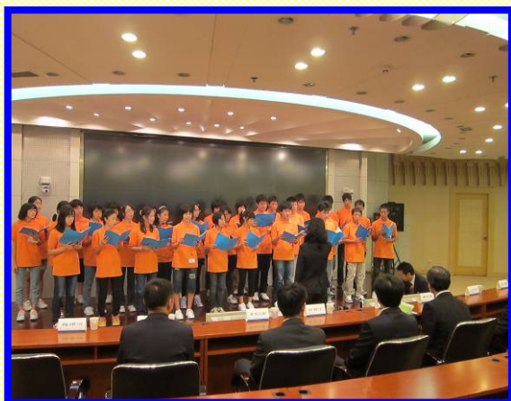
合唱「YELL」／海淀区政府・教育委員会にて披露