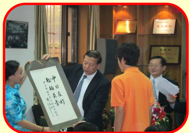
北京市中日友好農場からの記念品