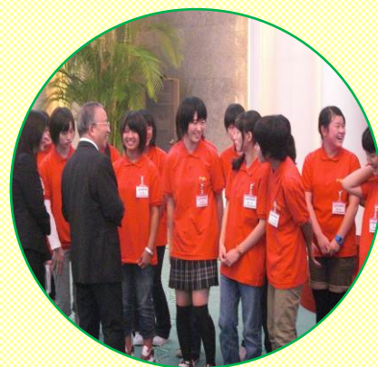
合唱「ありがとう」 釣魚台国賓館にて披露