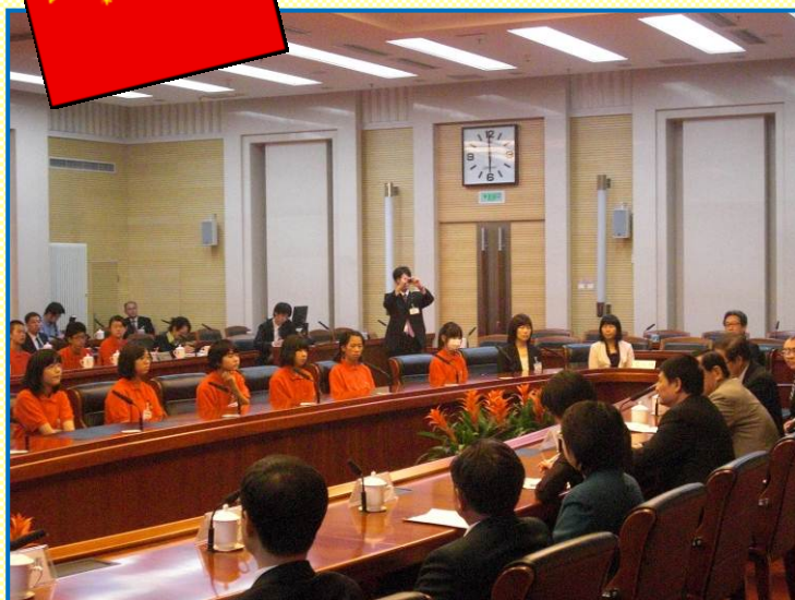
北京市人民政府 表敬訪問の様子