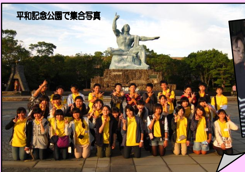
平和記念公園で集合写真

3泊4日という短い期間ではありましたが、長崎市民の心の温かさに触れられたのと同時に、団員それぞれ友情を深めあい、大きく成長できた長崎派遣でした。