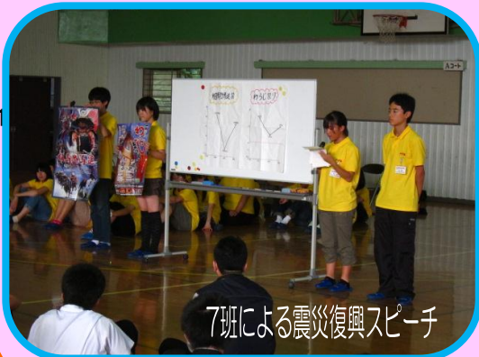
7班による震災復興スピーチ