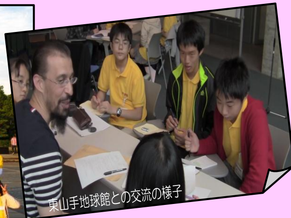
東山手地球館との交流の様子