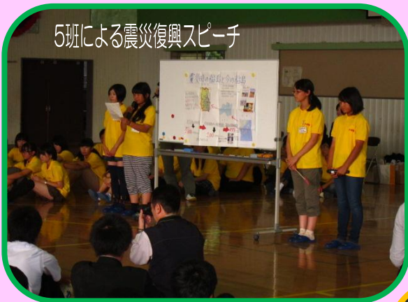
5班による震災復興スピーチ