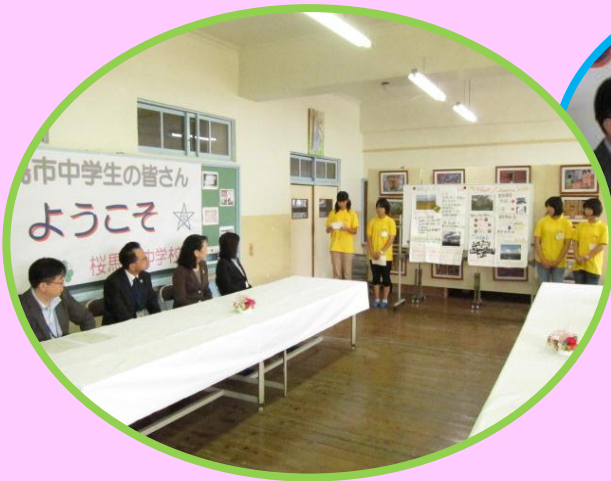
長崎市教育委員会の皆さんの前で『震災復興スピーチ』を披露する6班のメンバー