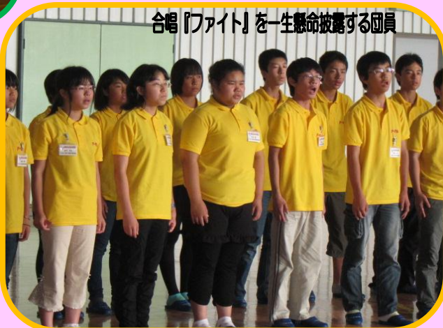
合唱『ファイト』を一生命披露する団員

派遣団は、模造紙や観光ポスターを駆使し、自分たちの言葉で『福島』の今を伝えてきました。