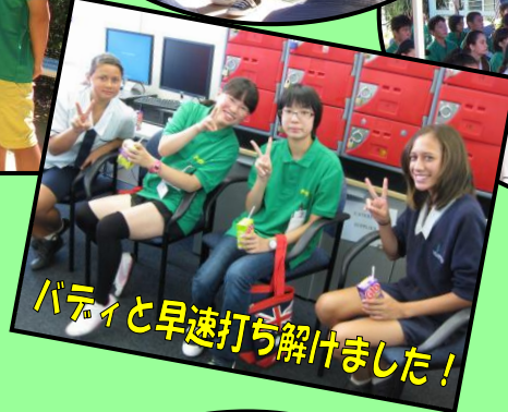
バディと早速打ち解けました!

バディとの初対面は緊張の様子が見られましたが、その後のティーパーティーでは笑顔で交流する場面もあり、すぐに打ち解けることができました。