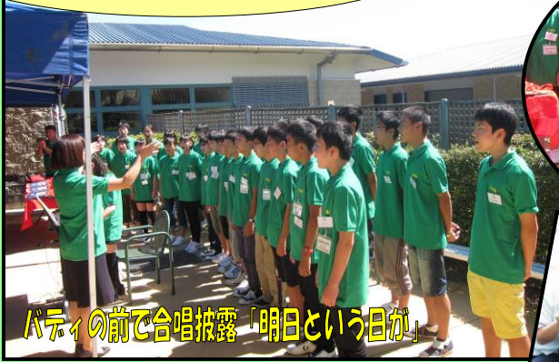
バディの前で合唱披露「明日という日が」