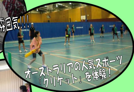
オーストラリアの人気スポーツ 「クリケット」を体験!