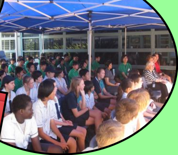
バディとの初対面

バディとの初対面は緊張の様子が見られましたが、その後のティーパーティーでは笑顔で交流する場面もあり、すぐに打ち解けることができました。