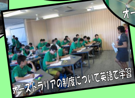
オーストラリアの制度について英語で学習