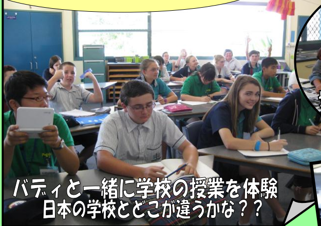
バディと一緒に学校の授業を体験 日本の学校とどこが違うかな？

2日間に亘る学校交流では、バディと一緒に歴史の授業や美術の授業などに参加したり、体育の授業でクリケットを体験したりなど、幅広く学校交流を行い、友情を深めました。