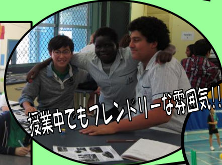
授業中でもフレンドリーな雰囲気!!!

2日間に亘る学校交流では、バディと一緒に歴史の授業や美術の授業などに参加したり、体育の授業でクリケットを体験したりなど、幅広く学校交流を行い、友情を深めました。