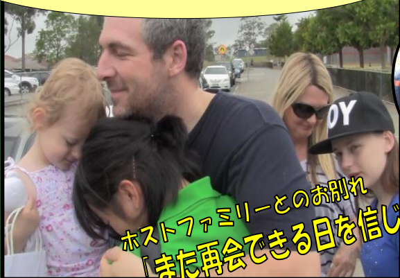
ホストファミリーとのお別れ 「また再会できる日を信じて！」