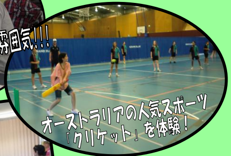
オーストラリアの人気スポーツ「クリケット」を体験！