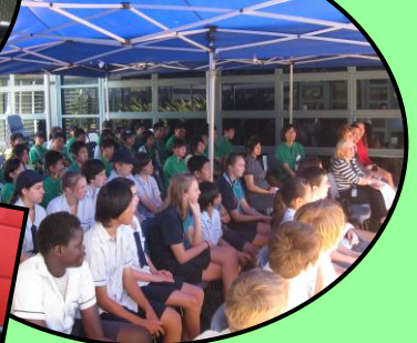
バディとの初対面