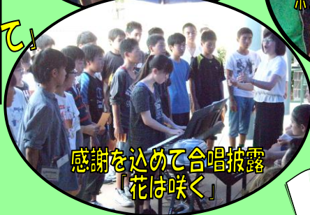
感謝を込めて合唱披露 「花は咲く」