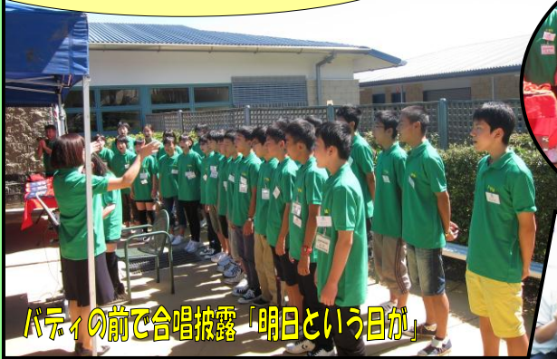
バディの前で合唱披露「明日という日か」

バディとの初対面は緊張の様子が見られましたが、その後のティーパーティーでは笑顔で交流する場面もあり、すぐに打ち解けることができました。