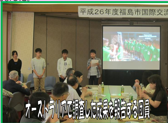
オーストラリアで調査した成果を報告する団員

総会からそのまま約60名の方にご参加いただき、中学生からの報告に耳を傾けながら、最後には質問も多数寄せられるなど。大変熱気のある報告会となりました。