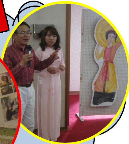
料理とベトナムについてお話しをしてくれた留学生