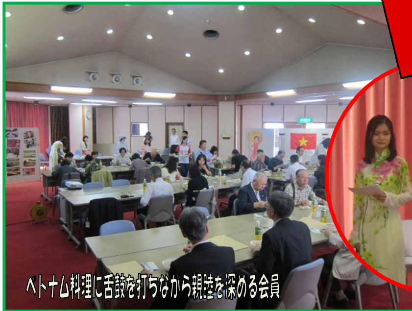
ベトナム料理に舌鼓を打ちながら親睦を深める会員