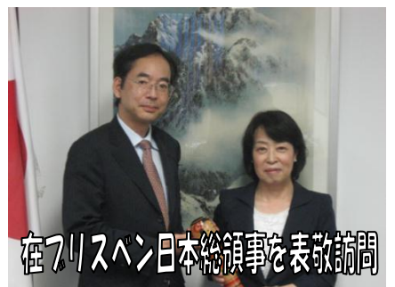
在フリスベン日本総領事を表敬訪問