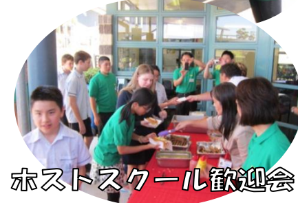
ホストスクール歓迎会

オーストラリアクイーンズランド州ブリスベン市に派遣された福島市の中学生29名は、現地の学校やホームステイ先で、オーストラリアの広大な自然の中で育まれた独自の生活スタイルや歴史、多民族文化を肌で体験し、国際的な感覚を養ってきました。