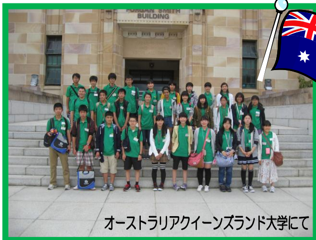
オーストラリアクィーンズランド大学にて

個人会員様、学生・生徒会員様、団体会員様のご理解ご協力をいただき、平成26年度も円滑な事業運営を行うことができました。厚く御礼を申し上げます。来年度もさらなる発展、多文化共生社会の実現に向けて努力してまいりますので、ご支援ご協力をよろしくお願いいたします。