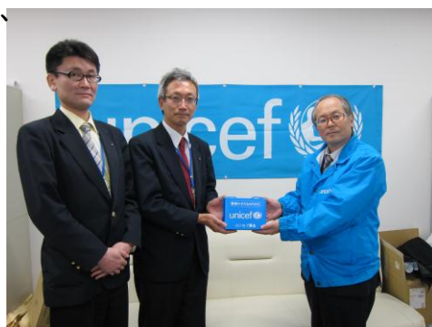
日本ユニセフ協会福島県支部を訪問

次年度につきましても、「結・ゆい・フェスタ2015」の盛大な開催に向けて取組んで参りたいと考えておりますので、各団体の皆様、そして関係者の皆様の引き続きのご支援・ご協力をよろしくお願いいたします。