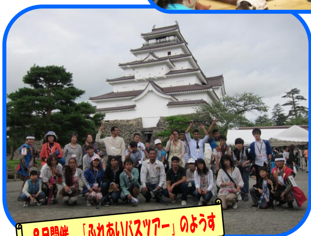
8月開催 「ふれあいバスツアー」のようす