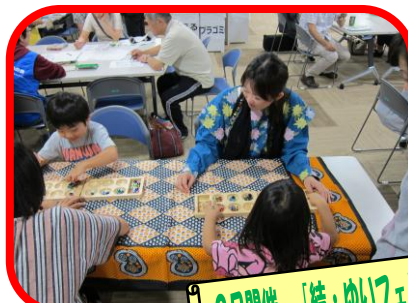
9月開催 「結・ゆいフェスタ2014」のようす