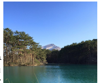
▲よく訪れた五色沼。

仕事以外では、私は水族館が好きで、アクアマリン福島はいつも訪れるのを楽しみにしている水族館です。また、五色沼が大好きで、吾妻小富士に登る楽しい時間を過ごしました。福島は山に囲まれているので、12年ぶりにスキーをして楽しみました。こんなにたくさんの経験をくれた福島県に心から感謝しています。