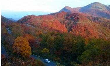
▲大好きな福島の景色。

福島は私が生まれ育った町や、三戸のような小さな町ではありませんが、毎日の生活は楽しいですし、ここに長く住みたいと思っています。