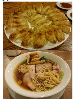
▲お気に入りのラーメンと円盤餃子♪