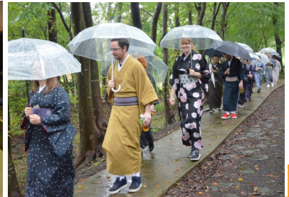
▲昨年度のイベントの様子